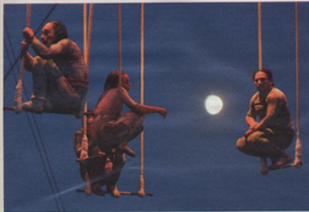
Die Compañía de Paso trotz in „Horizonte cuadrado“ der Schwerkraft