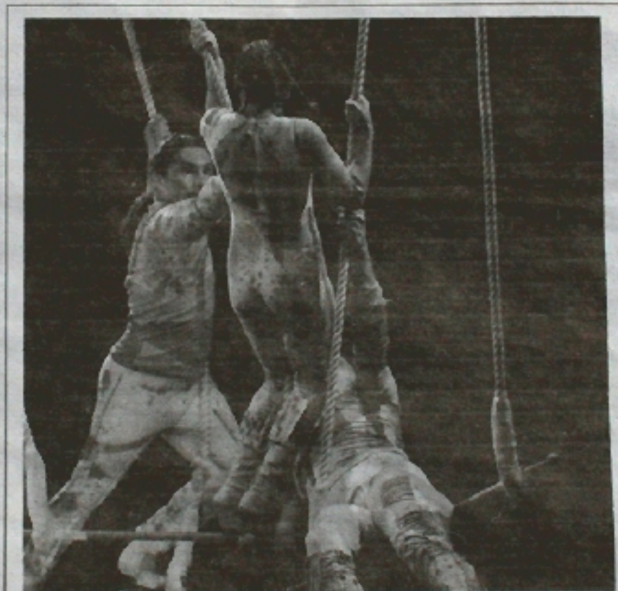
Torsion des corps et beauté des gestes

Spectacle onirique en diable, beauté des gestes autant que des lumières, virtuosité des corps qui ne toucheront jamais le sol. Il faut savoir entrer dans ce spectacle, se