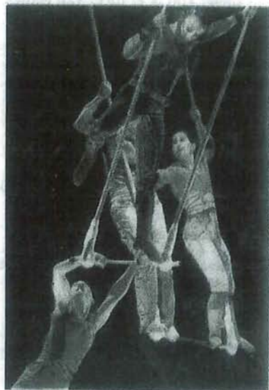
Acrobaten als een kluwen van lijven en touwen.

is het sterkst als de zes acrobaten zich bewegen als een organisme of de tentakels vormen van een zwerende octopus. Als dansers zonder vloer onder de voeten, verticaal hangend met klapwiekende onderlijven is de groep op haar sterkst. En jazer de samenstelling van drie vrouwen en drie mannen wordt uitgespeeld. Onder zwijmelmuziek verandert de rekstok in een tikkie ongemakkelijk vrijersbankje. Daarbij blijkt al gauw dat de kracht van de luchtacrobatiek niet ligt in tedere omhelzingen en liefdevol gekronkel om elkaar heen. Spannend wordt het pas als man en vrouw de rekstok betreden als een veel te krap strijdperk. Ze duwen elkaar, laten de ander vallen of zoeken klauterend langs een lijf hun weg weer naar boven. Meteen daarna blijkt een rekstok groter dan gedacht als alle zes de acrobaten zich voegen in een kluwen van lichamen en kabbelend heen en weer schommelen. De opbrengst van het onderzoek van Hirzel levert genoeg mooie